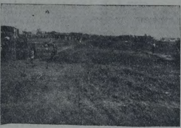
SIN INMODESTIA, ESO ES LA "AVENIDA" CORONEL ROCA. ES LA ÚNICA comunicación de Villa Soldati a Avenida Sáenz. Las otras calles están cortadas. El terraplén que se ve a la izquierda lo hicieron para contener las aguas del río que inundaban toda la zona. Pero con ello condenaron a los pobladores que construyeron sus humildes casas entre Roca y el río... Los concejales socialistas han pedido insistentemente la pavimentación de la "avenida".

"Para el arreglo, la conservación e higienización de las calles no pavimentadas del municipio, el departamento ejecutivo organizará"