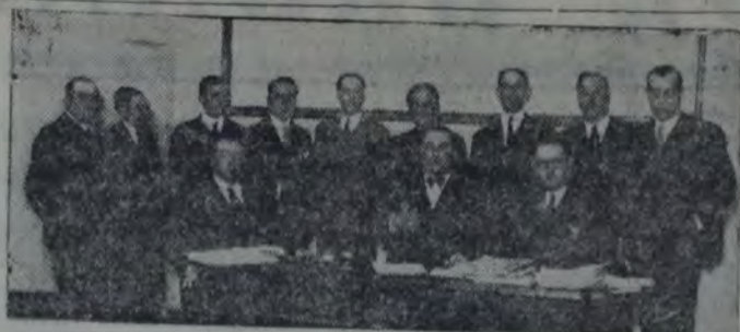
LA MESA DEL CONGRESO DE LAS SOCIEDADES DE FOMENTO Y UN grupo de delegados, en posesión para "La Vanguardia"

Solicitar el estricto cumplimiento de la ordenanza sobre cercos y veredas, y apoyar el proyecto de ley aprobado ya por la cámara de diputados, casi reproducción textual del que en 1926 presentó el ex diputado socialista Joaquín Coca.