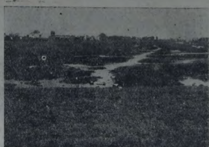
ENTRE LAS CALLES CONDOR, MON Y CENTENERA, HAY UN EXTENSO baldío cruzado por calles sin urbanizar. El especulador puso mano sobre él y lo sacó a remate. La fotografía fue sacada el mismo día en que se realizaron los compradores. Porque, lector amigo, el remate se efectuó con éxito. Los lotes de "un paraje de alta valorización... para el futuro", vendiéronse a precios altísimos: 120 mensualidades de 46, 44, 42 y 35 pesos... Son terrenos bajos. ¿Cuándo se pondrá término a las actividades de los rematadores, que abusan de la ingenuidad y de las necesidades de los trabajadores?... Remató Ciminnelli, irigoyenista, del sol que más calienta.

cuadrillas que actuarán con carácter permanente dentro de un radio preestablecido.