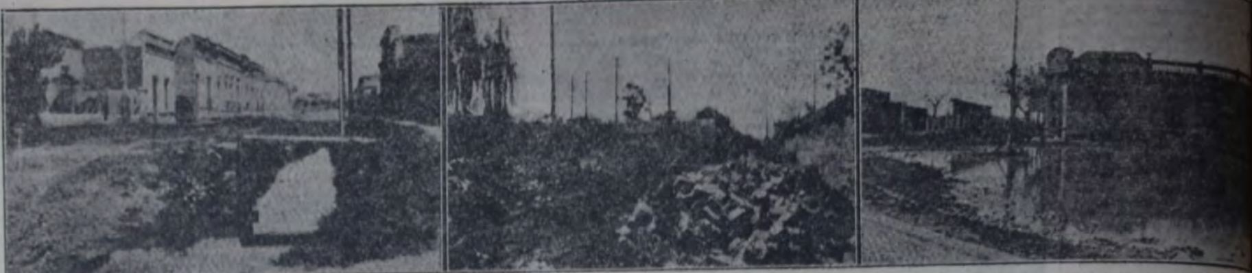
ESTADO DE LA CALLE MATHEU A LA ALTURA DE 25 DE MAYO en pleno centro de la ciudad. Las aguas estancadas permanecen en esta calle durante el invierno y el verano, con buen o mal tiempo; demás está decir que la descomposición de las mismas representa un peligro para la salud de los vecinos de esos lugares.