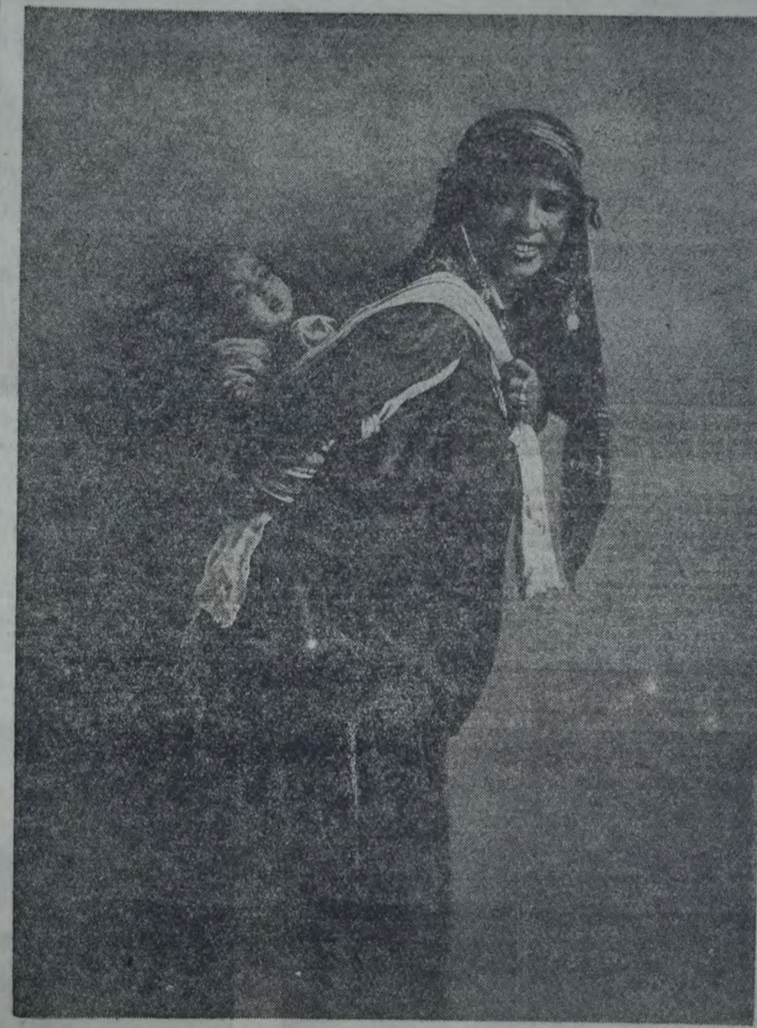
UNA MUJER BEDUINA CON SU HIJO A CUESTAS

Es necesario "ir hacia el ideal y comprender lo real", decía Jaurés. Es el primer sentimiento.